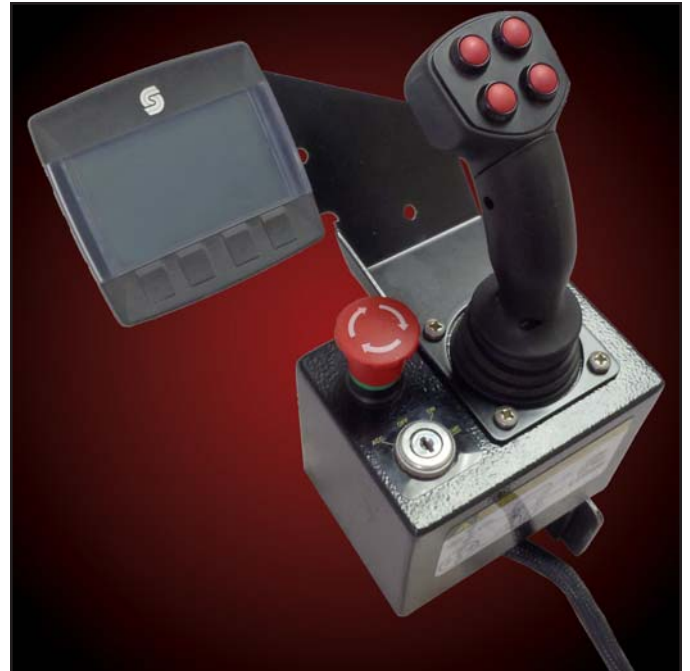
ÉCRAN À AFFICHAGE À NIVEAUX DE GRIS ACL ET LEVIER DE COMMANDE PLUS +1 DE SAUER DANFOSS