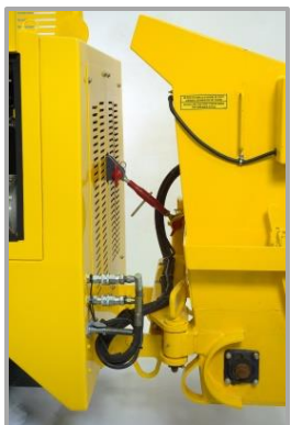
2 raccords à l'arrière