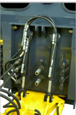
8 raccords à l'avant